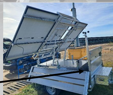
Déploiement automatique des panneaux

Compact et protégée pour le transport La prise pour connecter le mât pour accessoires