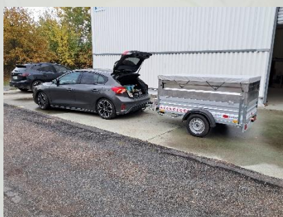
Déployée en moins d'une heure*

En haut du mât de 2m (en option), Jusqu'à 3 supports orientables pour caméra, spot, détecteur, etc... alimentés en 12 ou 24VDC ou 230VAC + 2 prises RJ45