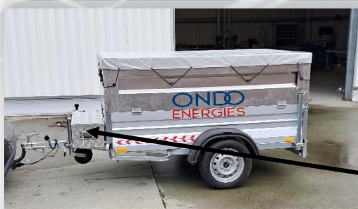
Le coffret de rangement pour bâche et accessoires.

Compact et protégée pour le transport La prise pour connecter le mât pour accessoires